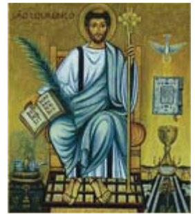
São Lourenço Diácono Padroeiro dos Diáconos