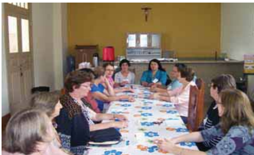
As esposas apresentaram propostas e projetos no Consultivo de Aparecida em 2008.

A Diretoria da Comissão Regional dos Diáconos – CRD Sul 1 convoca os presidentes ou representantes das Comissões Arquidiocesanas e Diocesanas dos Diáconos do Estado de São Paulo para a Reunião do Conselho Consultivo, que será realizada na Paróquia São Sebastião de Porto Ferreira, Diocese de Limeira, no dia 25 de julho de 2009, das 09h às 16h.