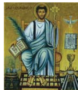
São Lourenço Diácono Padroeiro dos Diáconos