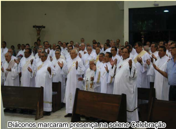
Diaconos marcaram presença na solene Celebração