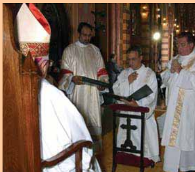
Profissão de fé, seguindo o rito da Igreja, diante do povo e do Bispo.