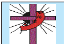
Diácono, imagem do CRISTO SERVO.