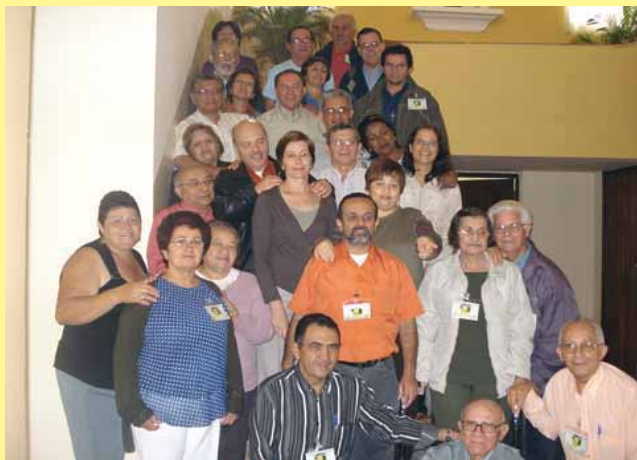
Texto e foto: Diác. Durán y Durán.

Realizou-se de 17 a 19 de agosto de 2007, na bela e acolhedora casa de encontros e retiros dos carmelitas em Camocim de São Felix, PE, o retiro organizado pela diretoria da Comissão dos diáconos da Província de Pernambuco, com a participação de trinta e cinco pessoas, alguns de outras províncias do Regional NE II.