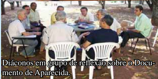
Diáconos em grupo de reflexão sobre o Documento de Aparecida.