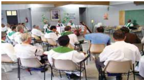
As Celebrações Eucarísticas foram muito bem preparadas pelos organismos.