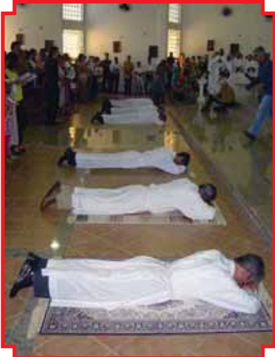
Ordenações em Franca/SP ocorreram no dia 12 de outubro.