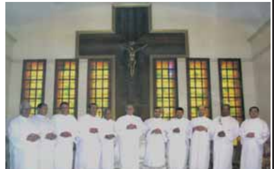
Os candidatos vêm coroar de pleno êxito a fidelidade aos estudos e à vocação diaconal.