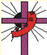
Diácono, imagem do CRISTO SERVO.