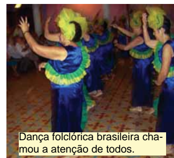
Dança folclórica brasileira chamou a atenção de todos.

"Envelhecer com alegria, mostrando os talentos, testemunhando aos jovens que a vida é bela e pode ser vivida com liberdade e sendo útil para a sociedade."