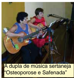
A dupla de música sertaneja "Osteoporose e Safenada"