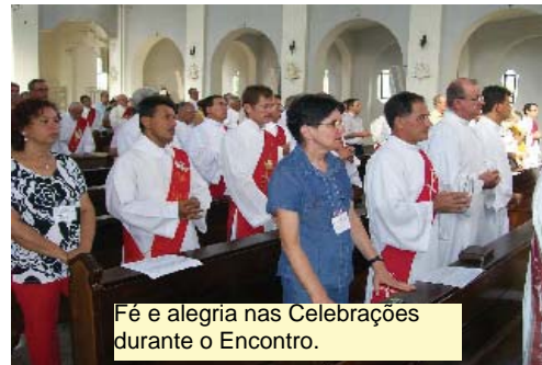
Fé e alegria nas Celebrações durante o Encontro.