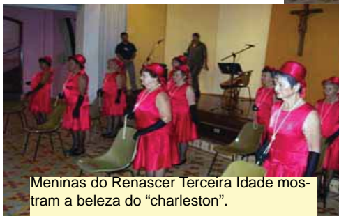
Meninas do Renascer Terceira Idade mostram a beleza do "charleston".