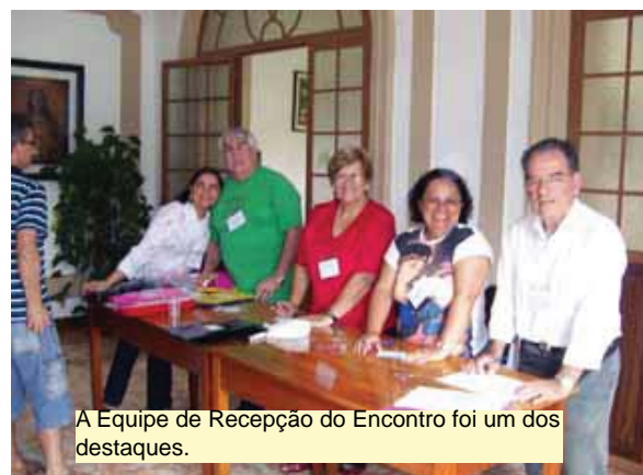
A Equipe de Recepção do Encontro foi um dos destaques.