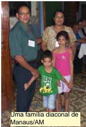
Uma família diaconal de Manaus/AM