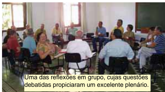
Uma das reflexões em grupo, cujas questões debatidas propiciaram um excelente plenário.