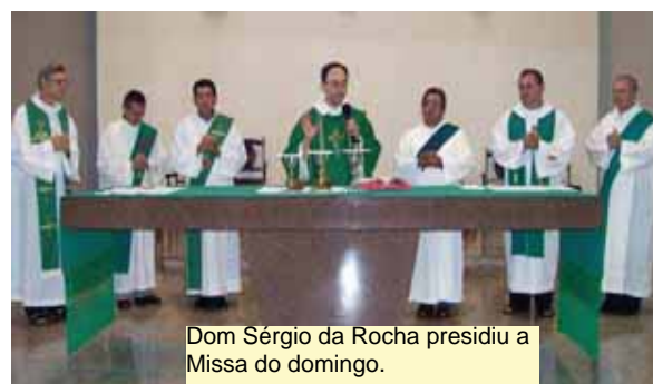
Dom Sérgio da Rocha presidiu a Missa do domingo.