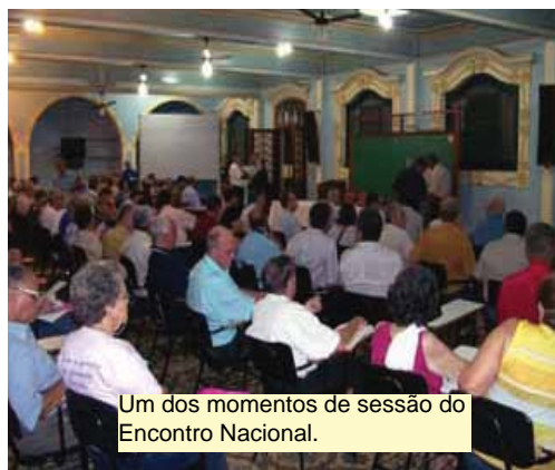
Um dos momentos de sessão do Encontro Nacional.