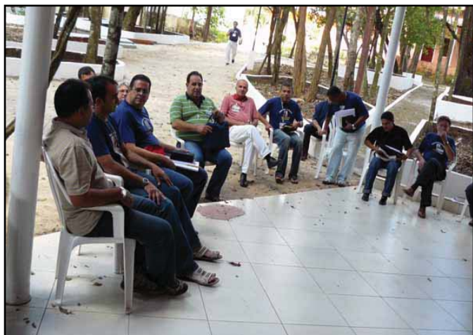
Trabalho em Grupo dos candidatos ao Diaconado.