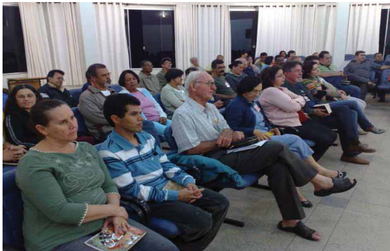
Plenário da Convivência de Diáconos, esposas e candidatos de Brasília.

Os diáconos permanentes da Arquidiocese de Brasília, juntamente com suas esposas e os alunos da Escola Diaconal Santo Estêvão realizaram nos dias 11 e 12 de julho a Convivência semestral.