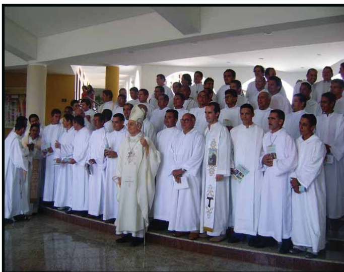
Candidatos de Castanhal receberam os Ministérios de Acolitamento e Leitorato.