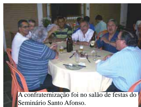
A confraternização foi no salão de festas do Seminário Santo Afonso.