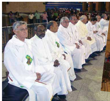
A Missa no Santuário Nacional foi celebrada no dia 28 de outubro e televisada pela Rede Vida de Televisão e TV Aparecida