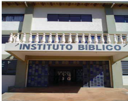
Instituto Bíblico de Brasília, local do Encontro de Diretores e Formadores de Escolas Diaconais